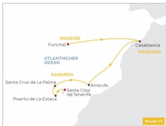
— Exklusiv für Kompaktkurs Maritime Medizin